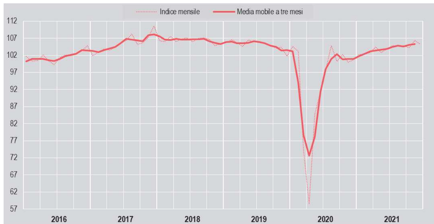
FIGURA 2. PRODUZIONE INDUSTRIALE, VARIAZIONI PERCENTUALI TENDENZIALI

Gennaio 2016 – dicembre 2021 (base 2015=100)